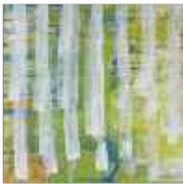
Rita Landolt Collagen/Zeichnungen www.werk-raum-kunst.ch