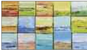
Eliz Bütikofer-Mendes Horizonte