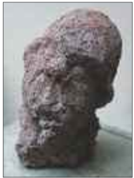
Doris und Thomas Huber Plastiken www.huber-bildhauer.ch