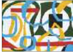
Oskar Pache Scherenschnitte