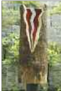
Roland Keiser Formen aus Holz