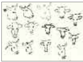
Bruno Birrer Jeden Tag eine Skizze