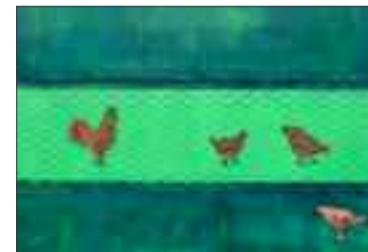
Lisbeth Knüsel Acryl