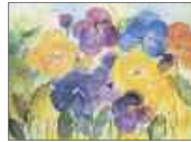
Gisela Capitelli Blumengarten