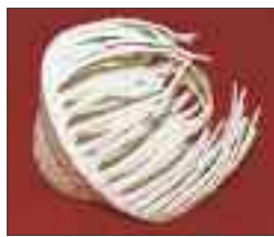
Erna Käppeli Alles Porzellan