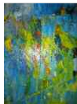
Giselle Thommen Oel/Acryl